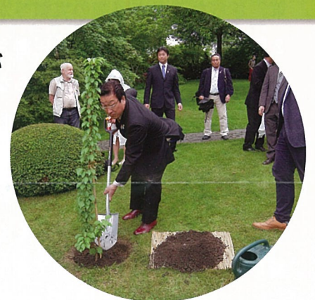
プラハ市植物園において記念植樹

1960年(昭和35年)以来、プラハ市側から京都市に対して姉妹都市の申し入れがあり、1994年(平成6年)京都で開催された世界歴史都市会議を契機に京都市が受諾、1996年(平成8年)プラハ市において姉妹都市提携盟約調印式が行われて、今年提携20周年を迎えました。プラハでは様々な周年事業が行われ、私も京都市代表団の一員として派遣されました。