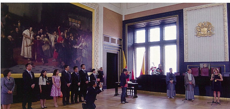
プラハ市旧市庁舎「儀式の間」において20周年記念式典