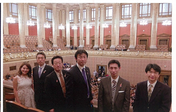
立命館大学男声合唱団メンネルコールとカレル大学合唱団の合同コンサート