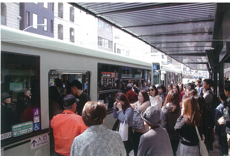
市バスの混雑風景