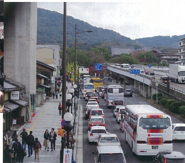
五条通の混雑風景