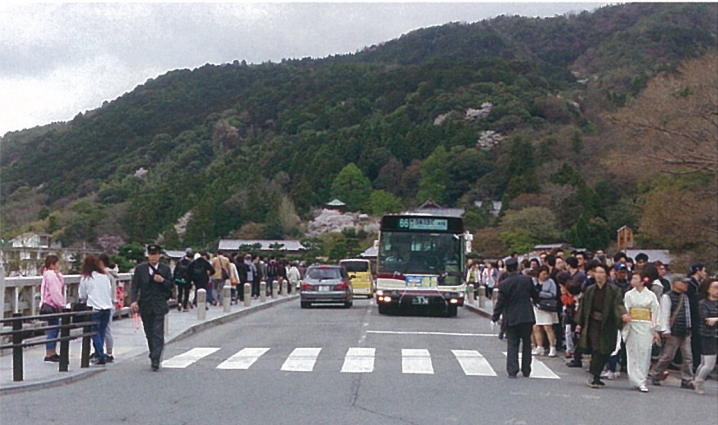
渡月橋の混雑風景